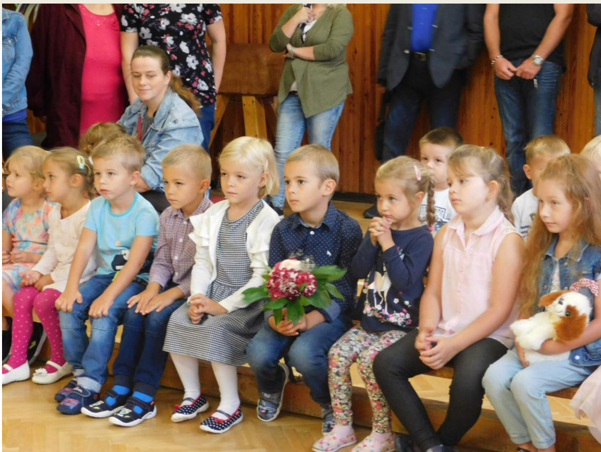
Letošní prvňáčci (společně se svými kamarády se školky) bedlivě poslouchají slavnostní řeč paní ředitelky a nemohou se dočkat, až usednou poprvé do svých školních lavic.

Doufáme, že budete se vzhledem a obsahem nových stránek spokojeni a stanou se jedním z míst, které budou spojovat naši školu s vámi, s veřejností.