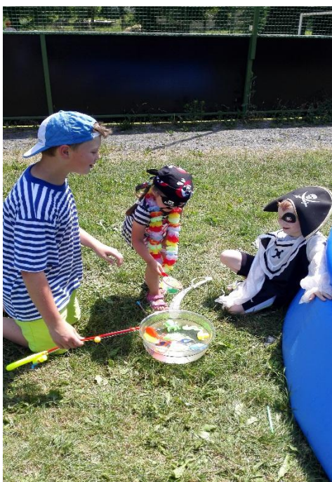
Nad úkoly pro malé piráty bedlivě dohlíželi jejich zkušenější kamarádi ze školy.