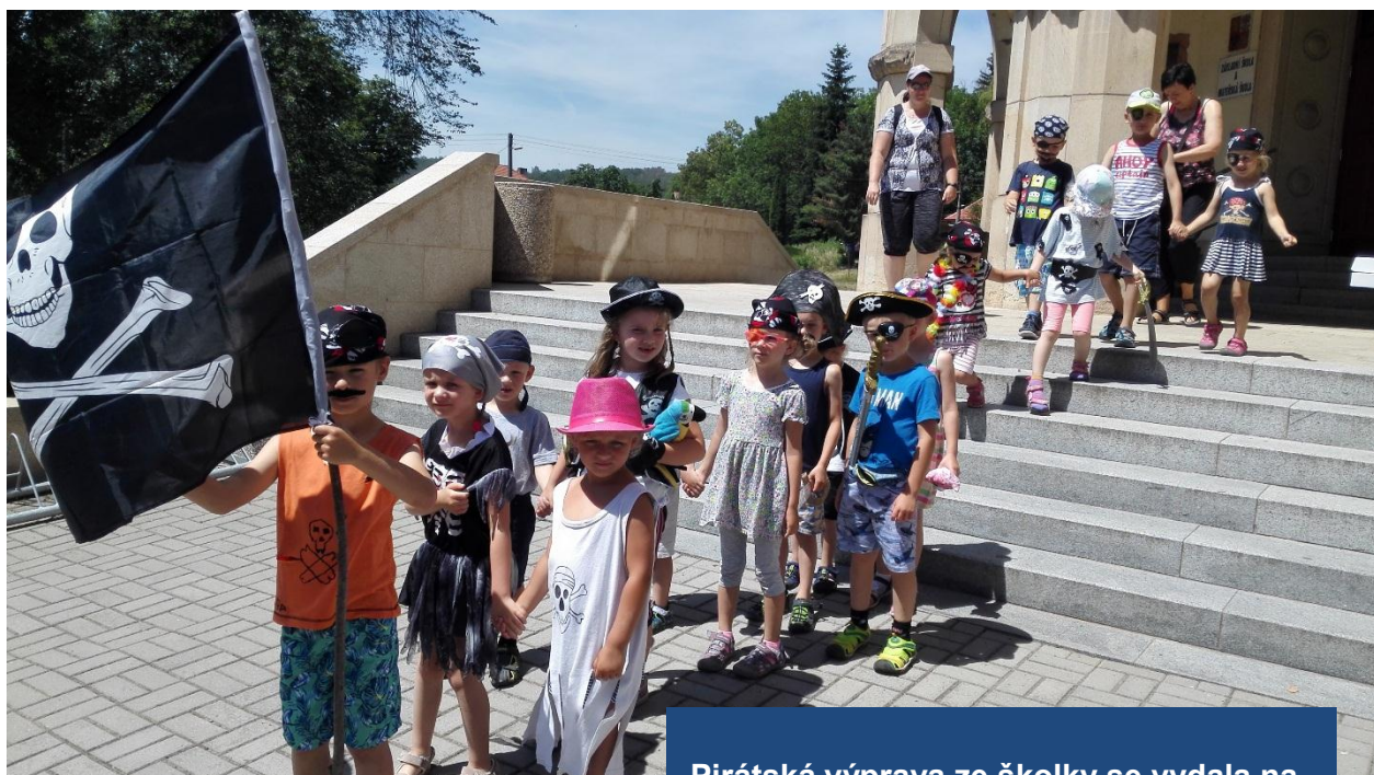
Pirátská výprava ze školky se vydala na Krušovické hřiště, aby objevila poklad kapitána Jacka Sparrowa.