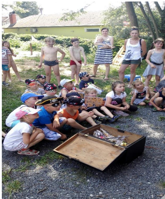
Truhla byla plná pokladů pro všechny.

Velké poděkování za pomoc a podporu patří Krušovické pekárně , která dodala pro malé piráty svačinky, a Hasičům , kteří zvládli napustit bazén a k tomu ještě postavit hrad.